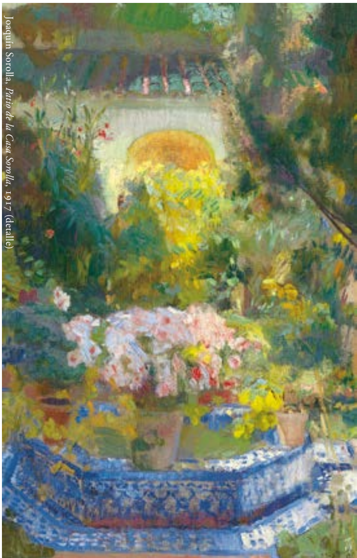
Joaquín Sorolla, Patio de la Casa Sorolla , 1917 (detalle)